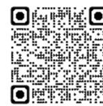
専用サイトの 2次元コード

おくやみコーナーをご利用ならずに、直接各窓口で手続きしていただくことも可能です。