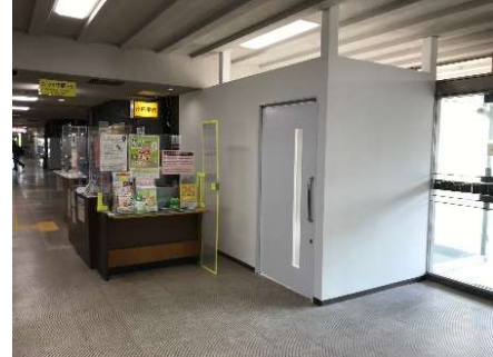
左：おくやみコーナーの位置図。 右：同コーナーの外観