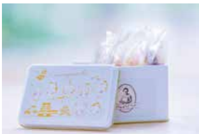
尼崎城×ステラおばさんのクッキーコラボ缶：750円（6枚入り・個包装）

「食べ出したら止まらない！」とSNSでも話題の「あまらむね」。大手通販サイトの菓子・駄菓子（ラムネ）部門で1位を獲得した岸田商事（尾浜町2丁目）のラムネをパッケージしています。卸売りが中心の会社ですが、尼崎のためになるならばと賛同いただいたことで「あまらむね」が生まれました。 カラフルでころんとしたフォルムがかわいいうあまらむねは、一つひとつが職人の手作り。大粒のラムネを