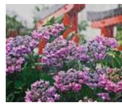
最優秀賞 [梅雨豪雨]

ID 1009254 園環境創造課 ☎ 6489 - 6301 FAX 6489 - 6300 12月16日～22日午前9時～午後5時 市役所中館1階市民相談担当前で、あまがさきの身近な自然写真コンテストの入選作品を展示します。 ◆カレンダーを無料配布 同期間午前9時～午後5時、同会場で、入選作品から選出した作品を掲載したカレンダーを配布します。先 1,500人(1人1部)。