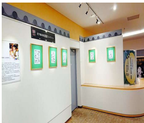
尼子騷兵衛オリジナルピクチャーコレクション

また、3種類の尼子騷兵衛展限定デザイン「あまらむね」や、キャラクター地名めぐりグッズなど、尼崎来訪の思い出となるようなお土産も販売しています。