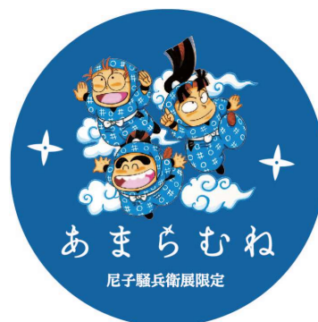
3種類の尼子騷兵衛展限定デザイン「あまらむね」を販売