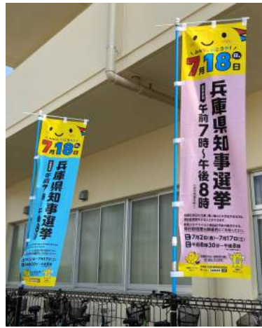
のぼり(県選管作成)