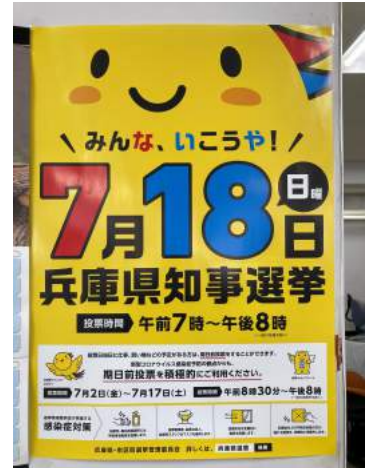
ポスター（県選管作成）