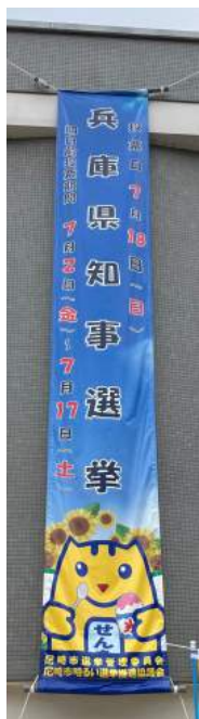
懸垂幕 (市選管作成)