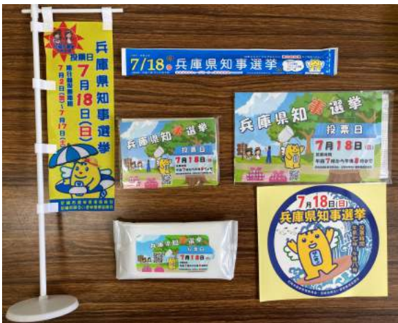
啓発物資（市選管作成）