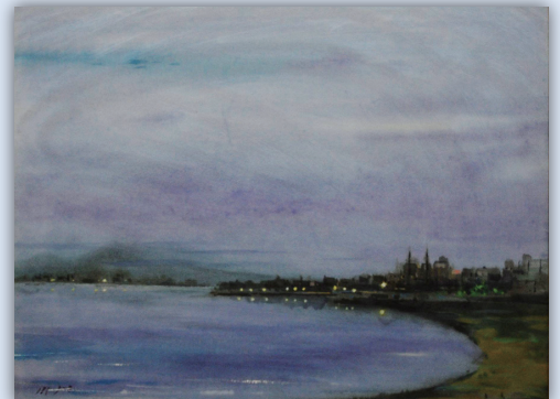
《朝霧 神崎の泊》 前田 正夫 (1981年)