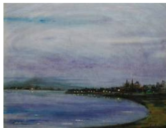
《朝霧 神崎の泊まり》前田 正夫（1981年）