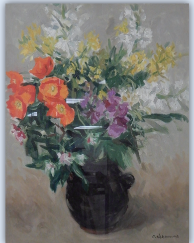
《静物 花》 中村 茂雄