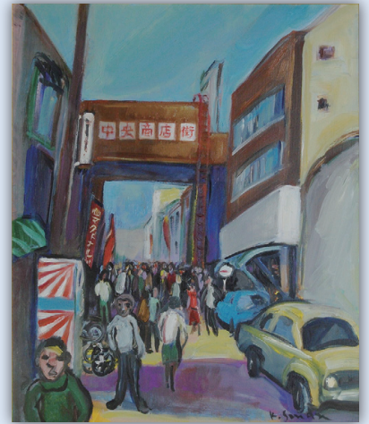
《街角 中央商店街》 三田 耕之 (1981年)