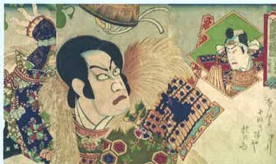
(上) 国周 絵本太功記十段目光秀 (部分) (左) 芳年 新形三十六怪撰 大物浦知盛出現