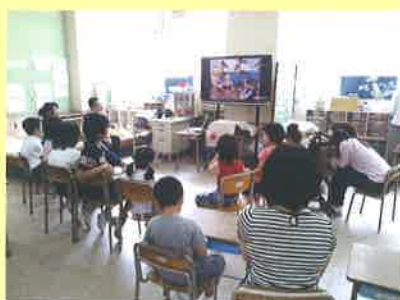
小学校での尼いもの学習 (左:苗植え付け、右:教室での学習)