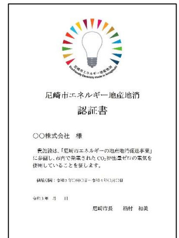
「尼崎市エネルギーの地産地消促進事業」 認証書

※上記以外に、本市の公共施設である「尼崎城」及び「尼崎市立歴史博物館」に電力を供給。