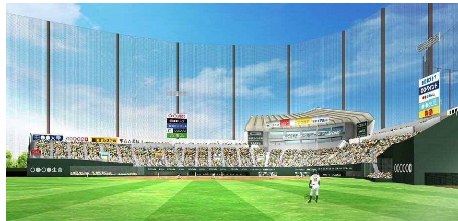
タイガース野球場内イメージパース