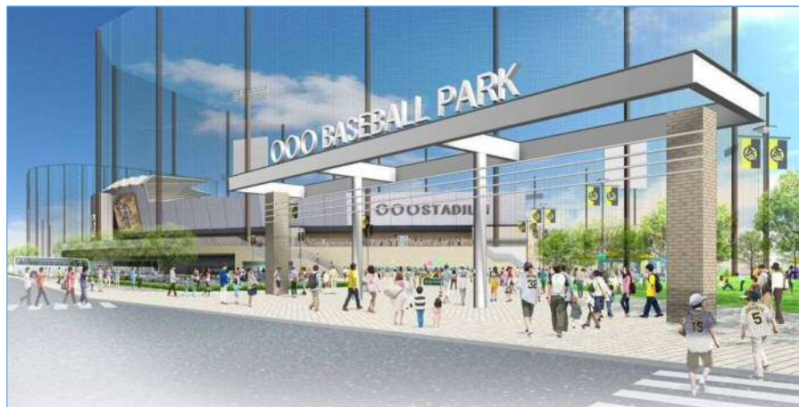
公園北西入口部イメージパース