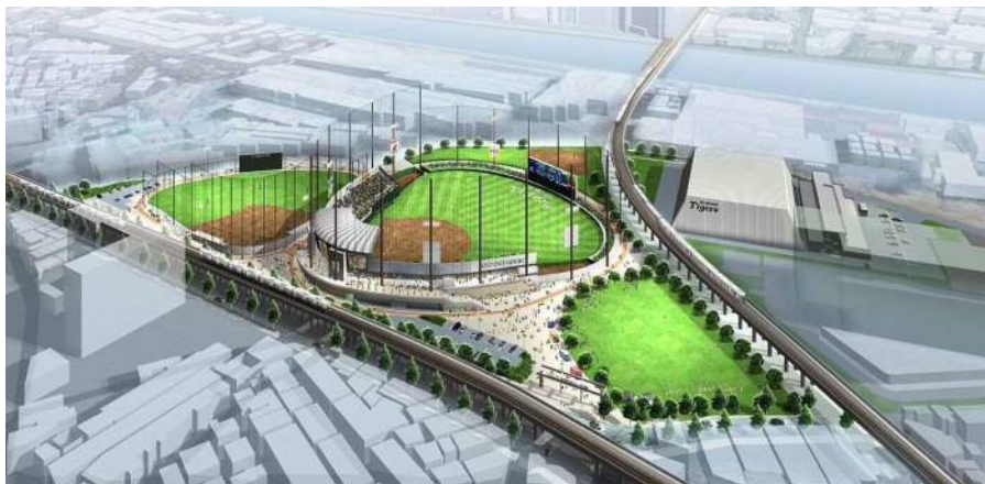
公園全体イメージパース