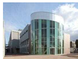
《尼崎双星高等学校》