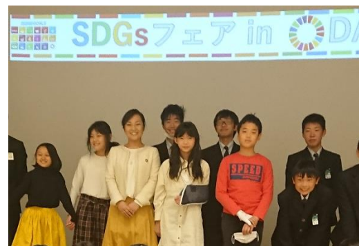
SDGs フェアで発表したときの浜小5年生