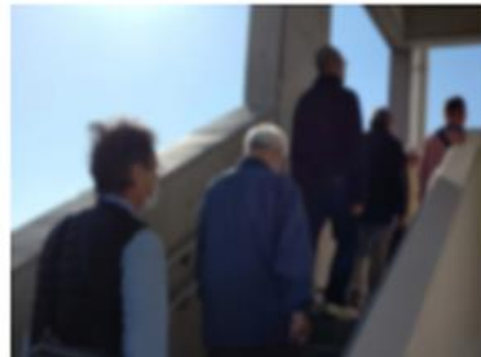
垂直避難訓練 (金楽寺小学校)