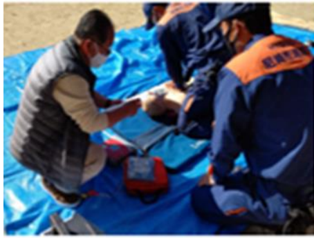
AED活用訓練 (金楽寺北公園)