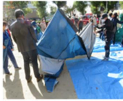
パーティション組立訓練