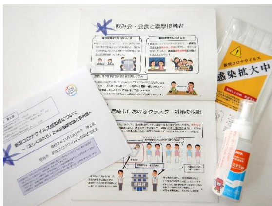
感染予防啓発グッズ