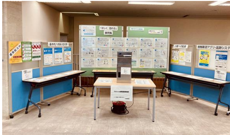
『新型コロナを「正しく恐れる」特設展示』

この度、より多くの方に広く周知するため、本庁舎南館 1 階に『新型コロナを「正しく恐れる」特設展示』を設置しました。市民の皆様におかれましても、この「事例集」を通じて、正確な情報の理解や、新型コロナウィルスに立ち向かう方々への配慮に、ご協力をお願いいたします。