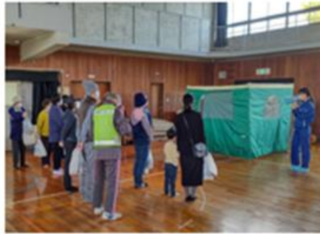
感染症対策パーティション説明