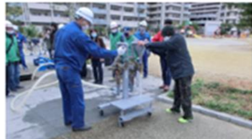
応急資器材手順確認訓練