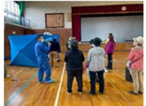
パーティション組立体験