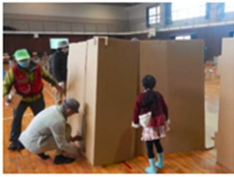
パーティション組立訓練