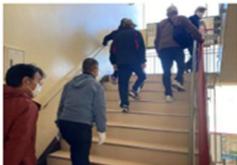
垂直避難訓練 (県立尼崎高校)