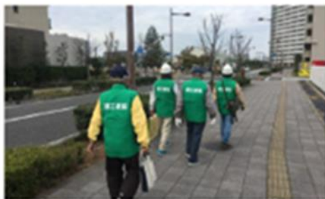
避難誘導確認訓練