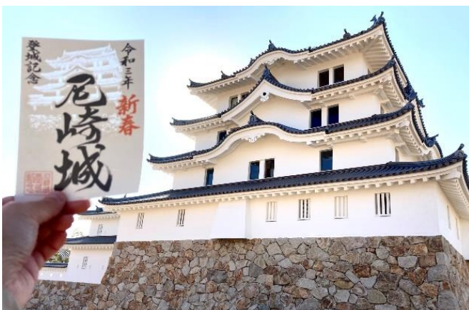
(参考) 特別登城記念証の尼崎城が透けて、青空色になっている。

尼崎城の特別登城記念証は、1日でも早く新型コロナウイルス感染症に打ち勝つ“明るい未来”を見通せる新年になるよう、願いを込めています。