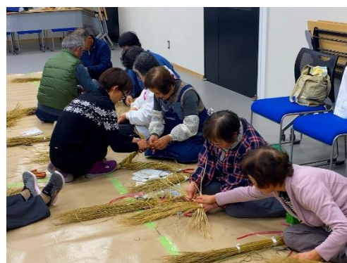
昨年度の講座風景