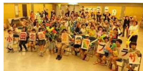
昨年の「おだのまなびヤ! 2019」閉会式の様子