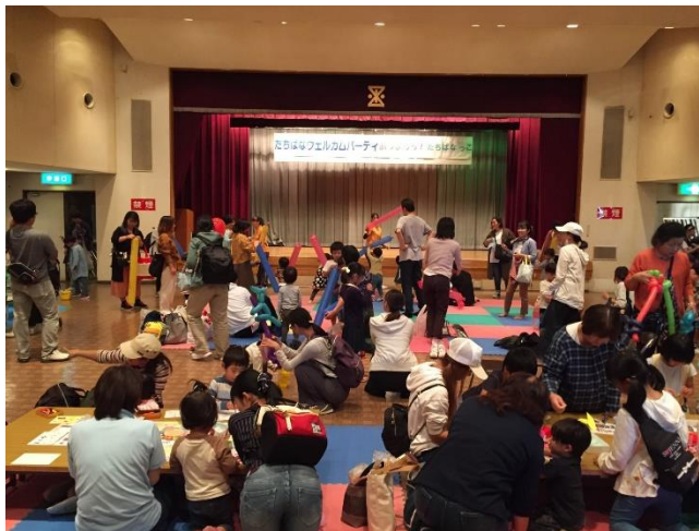
令和元年度「たちばなウェルカムパーティ」の様子

令和元年度まで子育て支援に関わる団体等によるブースや展示などを設けて開催した「たちばなウェルカムパーティ」を、令和2年度はスタンプラリー形式に変更し、子どもや保護者が楽しみながら同地区内にある施設の場所や役割、活動団体について知ってもらう機会とします。