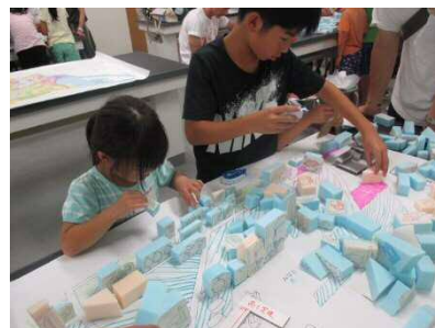
「みんなのサマーセミナー2019」の様子

尼崎市では、都市計画をもっと生活に身近なものとして捉えていただくために、「都市計画読本」を用いた地域住民のための座学やまち歩き、親子向けのワークショップのほか、小学校への出前授業等を行っています。昨年は、「みんなのサマーセミナー」において、実際に机上でまちをつくる親子向けの講座を実施しています。Facebookの専用ページもご覧ください！