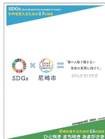
「尼崎版 SDGs 2020ver.1」 リーフレット表紙

引き続き、本市は誰一人取り残さない社会の実現を目指し、SDGs達成に向けた取り組みを進めます。