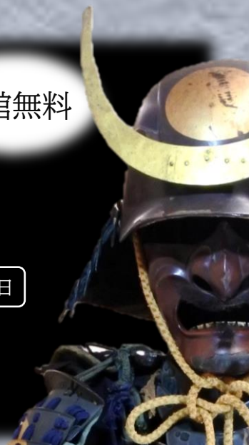
覚岸院様御召御具足（大垣市教育委員会所蔵）