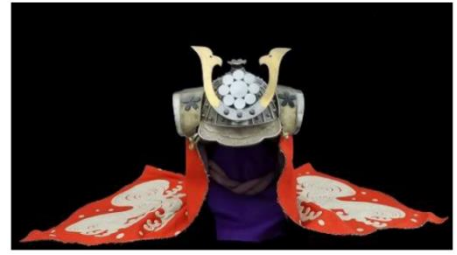
火事兜（2階常設展示室（近世））

2階の常設展示では、尼崎の原始・古代から近・現代までの歴史の流れを分かりやすく紹介します。各時代を象徴する実物の歴史資料や文化財を展示するとともに、訪れた誰もが関心を持ってもらえるよう復元模型や解説パネルなども活用しています。3階の企画展示室では、特定のテーマに基づく特別展や企画展を開催します。また、3階の地域研究史料室（あまがさきアーカイブズ）では、これまで地域研究史料館が担ってきた公文書館機能を引き継ぎ、歴史的公文書等の閲覧やレファレンスサービスを行います。（詳細は別紙参照）