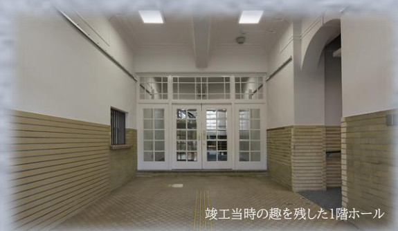
竣工当時の趣を残した1階ホール