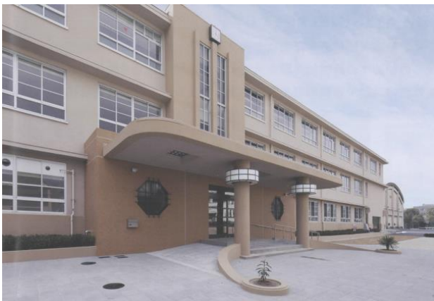
尼崎市立歴史博物館