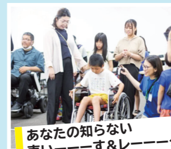
あなたの知らない 車いす&レーク