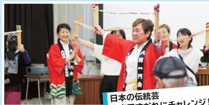
日本の伝統芸 南京玉すだれにチャレンジ!