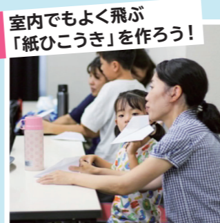
室内でもよく飛ぶ 「紙ひこうき」を作ろう!