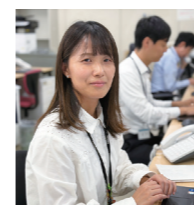
事務職 デジタル推進課

入庁前は「役所＝堅い、前例踏襲」というイメージを持っていましたが、実際は新しいことに前向きな先輩職員が多く、ギャップがなかったことがギャップだと感じ