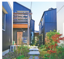
田能3丁目地区 建築協定の住居