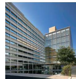
タクマビル新館 (研修センター)