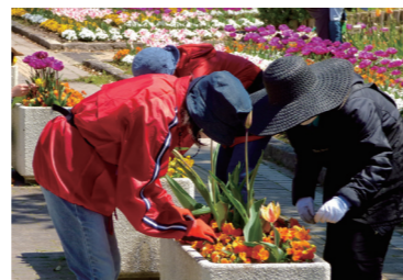
都市緑化植物園 グリーンヘルパー