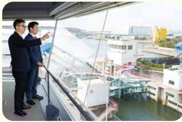
コントロールセンターでまちを眺めながら（防災意識の啓発に資するため、管理者から特別の許可を得て入場しました）

いましたよ。そして今や、「住みたい街ランキング」に入るような変貌ぶりに驚きます。