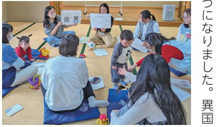
ベトナム語通訳や保健師も参加「ベトナムママさんいらっしやーい!」

ベトナム語通訳や保健師も参加「ベトナムママさんいらっしやーい!」 本市で子育てをしているベトナム国籍の人を対象に、育児に関する悩みなどを相談できるイベント「ベトナムママさんいらっしやーい!」を実施しています。