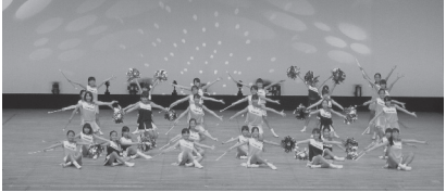
バトン隊の演技の様子

同隊は、現在約 200 人で活動しており、毎週土曜日に市内の各施設で練習しています。