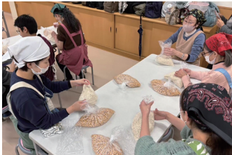
前回のぴんしゃんウォーキングとお味噌づくり教室の様子