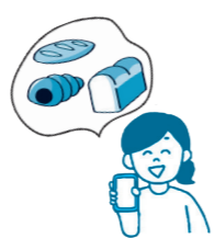
お得に食品を購入