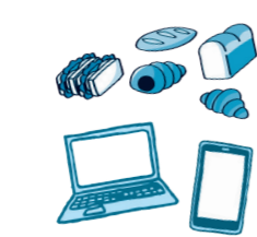
登録店舗が TABETE で販売