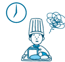
食品ロス発生危機

本市は、㈱コークッキングと協定を締結し、食品ロス削減に取り組んでいます。同社のフードシェアリングサービスアプリ「TABETE」を利用すると、閉店時間までに店舗で売り切ることが難しい食品をお得に販売・購入することができ、食品ロス削減にもつながります。