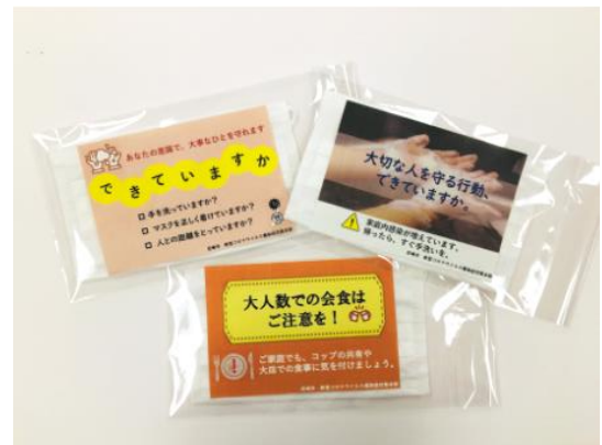
啓発チラシ付きマスク

20代～40代の会社員の感染者が増加していることから、通勤ラッシュの時間帯に合わせ、乗降者数の多い下記の駅において実施します。