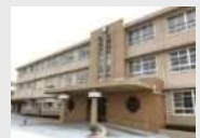
成良中学校琴城分校の外観