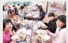
実はすごかった、「小学校給食」→