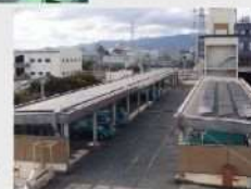
クリーンセンター太陽光発電所 →