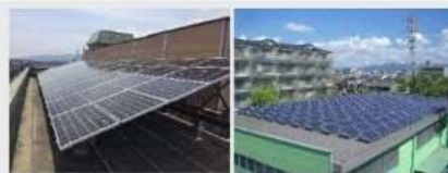
↑屋根貸し事業により設置された太陽光発電設備

また、市が所有する公共施設の屋根を有償で貸し出し、そこに事業者が太陽光発電設備を設置し発電事業を行う、いわゆる屋根貸し事業を実施することにより、太陽光発電の普及を促進するとともに、災害時や計画停電時などの非常時における電源の確保を図ります。