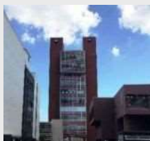
ひと咲きタワー (写真中央)

あまがさき・ひと咲きプラザは、子どもから大人まで、市民の学びと育ちを支える拠点です。