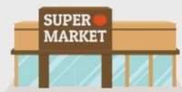
尼崎市内のフードドライブ実施店舗等