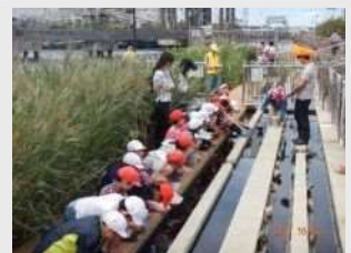
↑ 運河での環境体験