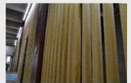
兵庫県産ひのきを 活用した縦格子

本庁舎南館の2階には、耐震化のため鉄骨プレースを設置していますが、歩行者の安全確保等のため、兵庫県産のひのきを活用し、縦格子を設置しています。