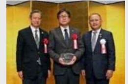
第9回あましんグリーンプレミアム (SDGs特別賞)

第9回目となる2019（令和元）年度には、選考委員会特別賞として「SDGs特別賞」が新たに選定されました。