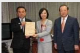
環境モデル都市選定書授与式