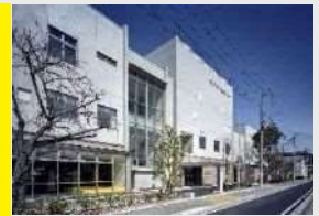
↑中央北生涯学習プラザ