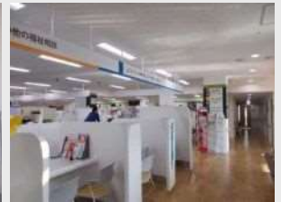
総合的な相談支援を行う保健福祉センター