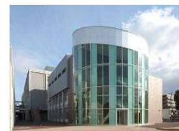
《尼崎双星高等学校》

(72) 施設維持管理事業費 ① 施設数 2校 ② 竣工年 昭和41年～平成22年 ③ 管 理 直営管理