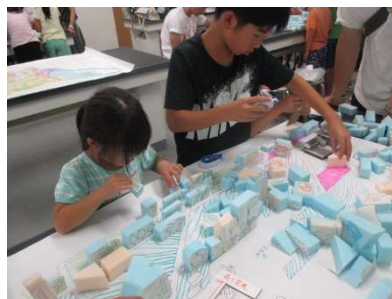
「みんなのサマーセミナー2019」の様子

尼崎市では、都市計画をもっと生活に身近なものとして捉えていただくために、「都市計画読本」を用いた地域住民のための座学やまち歩き、親子向けのワークショップのほか、小学校への出前授業等を行っています。昨年は、「みんなのサマーセミナー」において、実際に机上でまちをつくる親子向けの講座を実施しています。Facebookの専用ページもご覧ください！