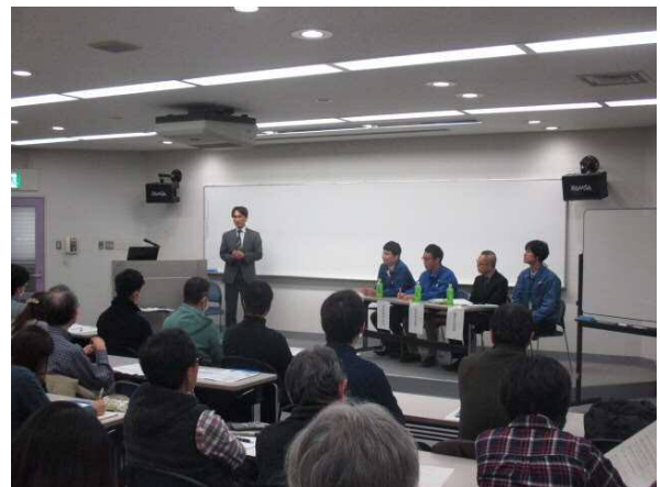
前回のまちづくり講座の様子