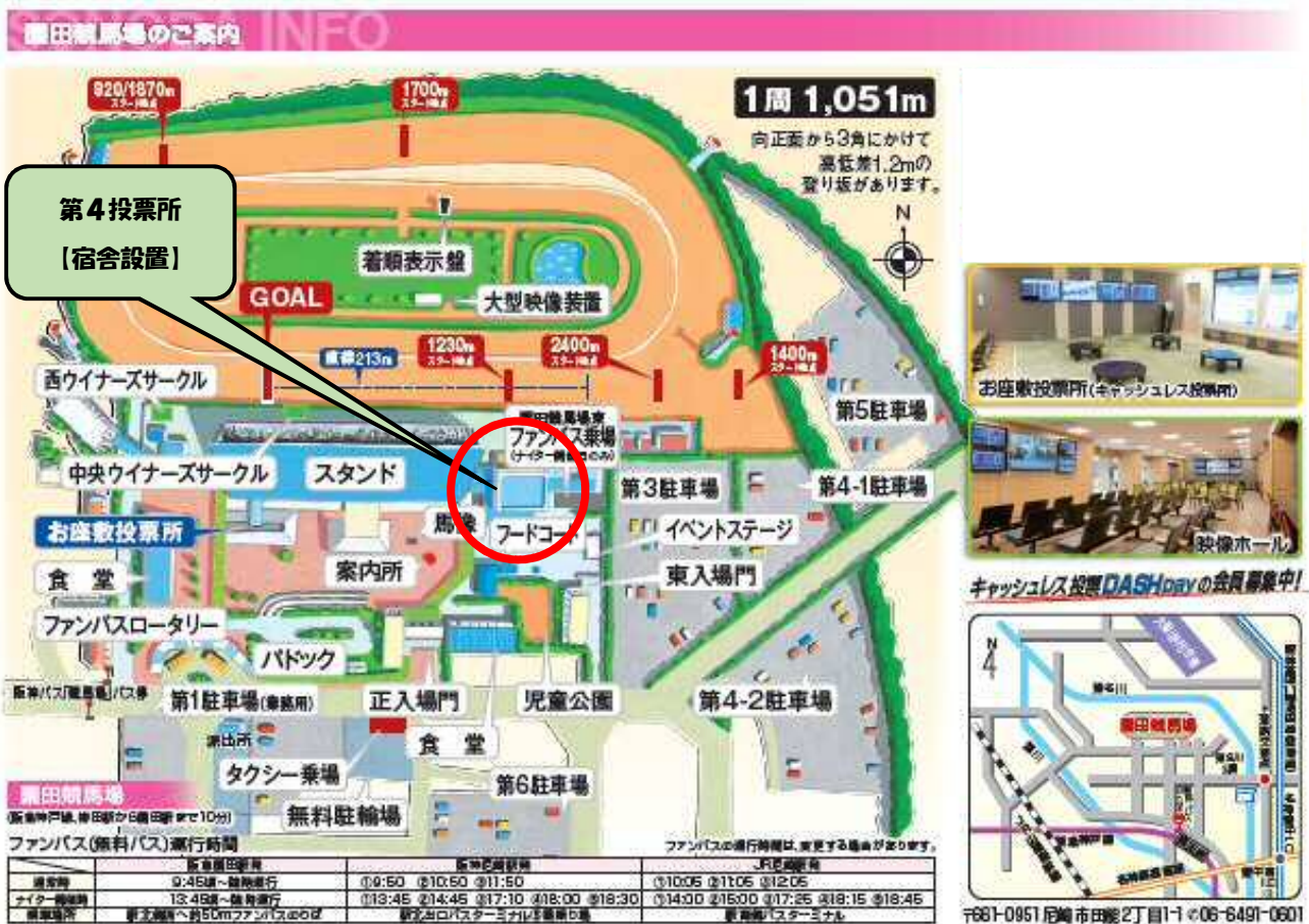
園田競馬場配置図