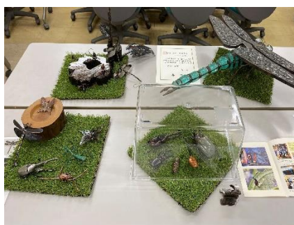
創作金物昆虫模型展示