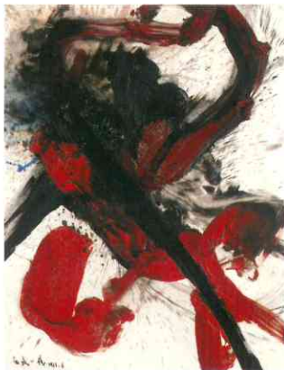
《地震皇門神》油彩/キャンバス、1961、兵庫県立美術館蔵(山村コレクション)