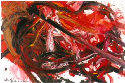
《天空星急鋒》油彩/キャンバス、1962、兵庫県立美術館蔵

本展は、東京で初の本格的な個展として、初期から晩年までの絵画約60点をはじめ、驚くべき先駆性をもつ実験的な立体作品や伝説的パフォーマンスの映像、ドローイングや資料も加え、白髪一雄の活動の全容に迫ります。