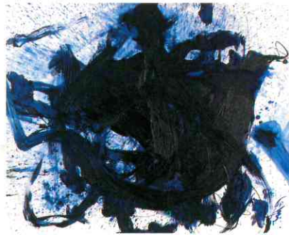
《群青》油彩/キャンバス、1985、尼崎市教育委員会蔵(尼崎市立尼崎高等学校)