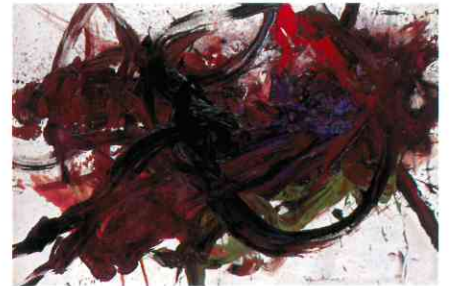
《無題》油彩/キャンバス、1959、豊田市美術館蔵