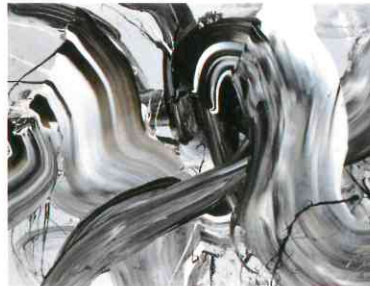
《貫流》油彩/キャンバス、1973、東京オペラシティ アートギャラリー蔵