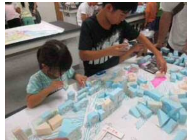
「みんなのサマーセミナー2019」の様子

平成27年2月に完成した、尼崎の風景イラストから都市計画のルールをわかりやすく解説した読本です。大人向けと子ども向け(クイズ形式)の2種類あります。市ホームページのほか、各支所地域振興センターや中央・北図書館等でご覧いただけます。