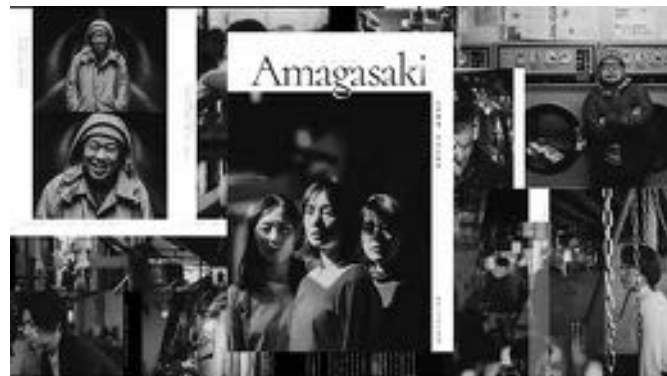
本市シティプロモーションの取り組み事例(尼崎市ブランドブック)