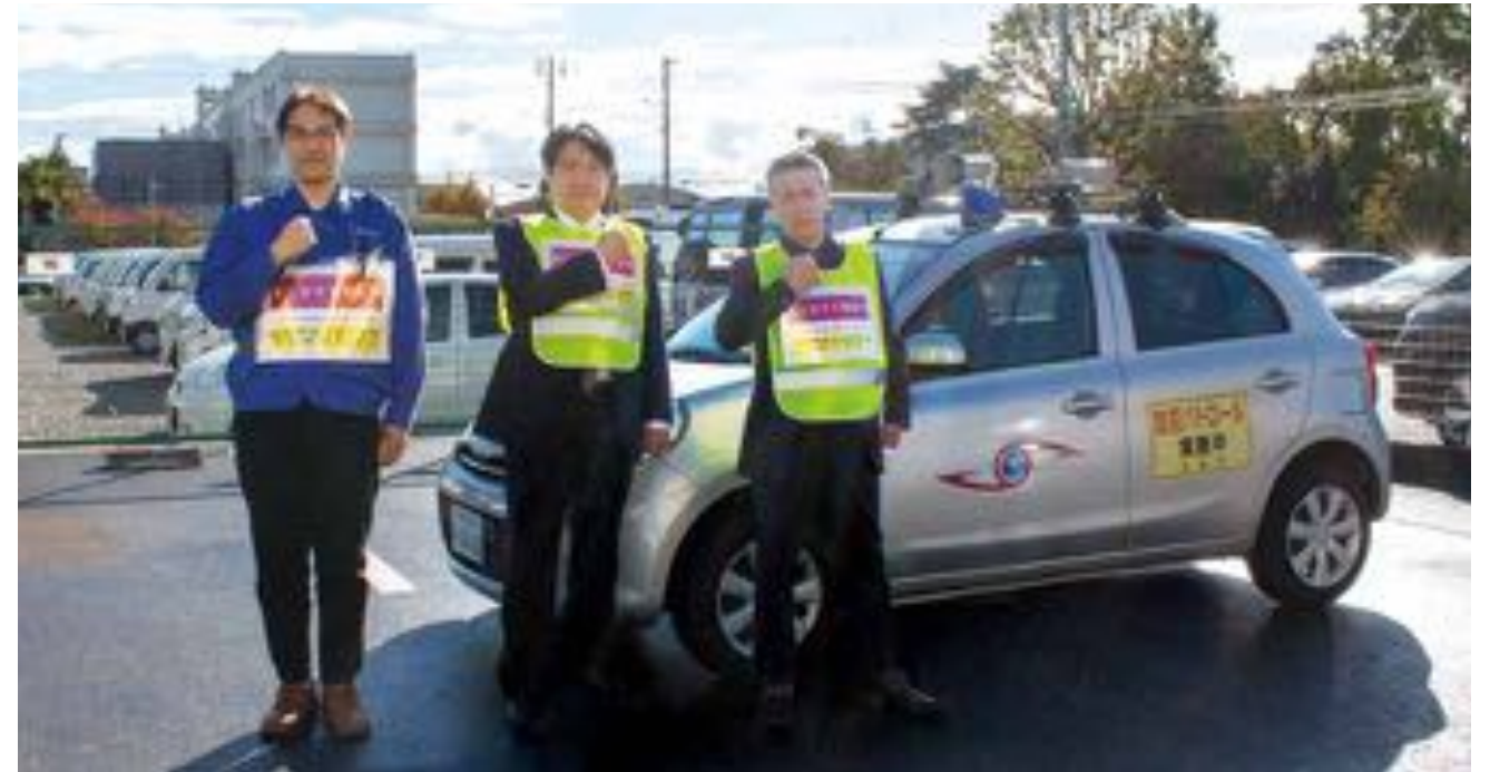
生活安全課では、日々防犯パトロールに出動しています

☎生活安全課 〒660-8501【住所不要】 ☎ 6489-6502 FAX 6489-6686。