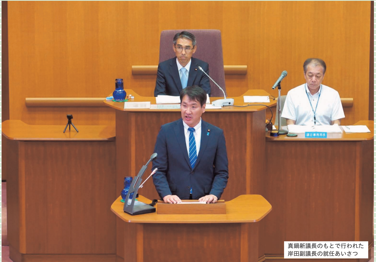
真鍋新議長のもとで行われた 岸田副議長の就任あいさつ