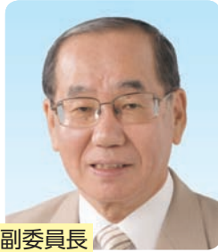
副委員長 とくだ みのる 徳田 稔 71歳②(共産)