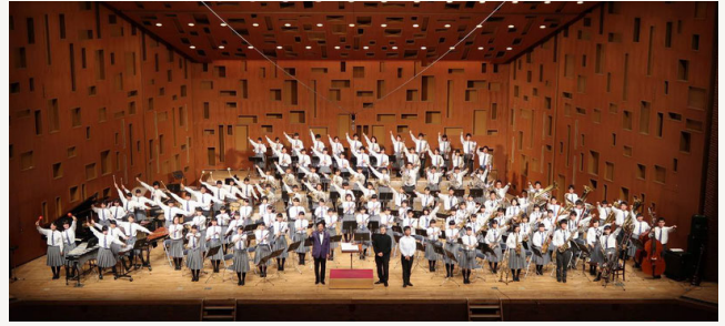
■ 尼崎市立尼崎双星高等学校吹奏楽部