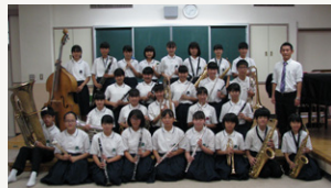
■ 尼崎市立小田北中学校吹奏楽部