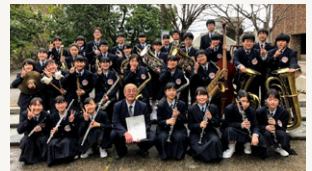
■ 尼崎市立成良中学校吹奏楽部