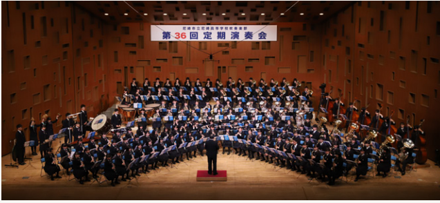
■ 尼崎市立尼崎高等学校吹奏楽部