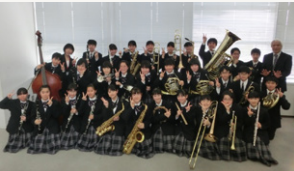
■ 尼崎市立小田中学校吹奏楽部