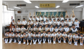
■ 尼崎市立立花中学校吹奏楽部