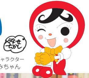
人権イメージキャラクター 人KEN あゆみちゃん