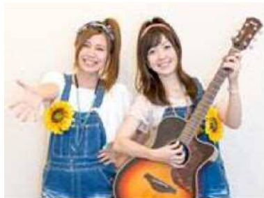
尼崎市選挙PR大使 あまゆーず

尼崎市出身のフォークデュオ。尼崎市を中心に活躍している。また、平成31年3月29日（金）から一般公開された尼崎城のPRソング「ただいま参上！尼崎城」も唄っている。