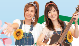
尼崎市選挙PR大使:あまゆーず