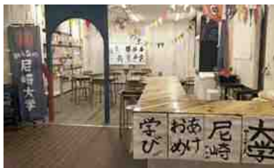
▲いつもの開催場所「みんなの尼崎大学秘密基地」はこんな感じ。