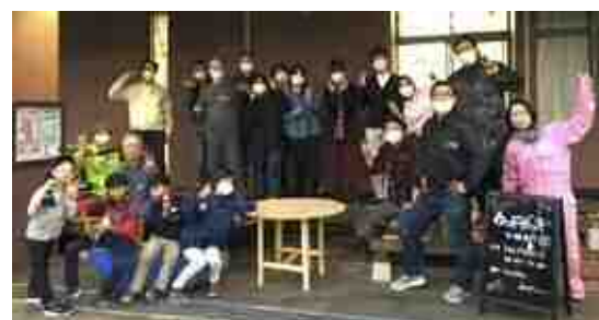
▲外に出ると、のべ100人以上の人が参加してDIYで作ったウッドデッキが。