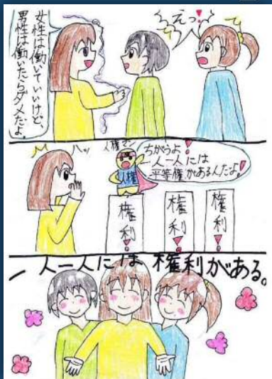
「一人一人の権利」 あまきたさん (小学生)