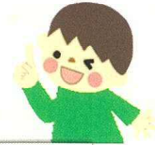
あまがさき人権イラストマップ