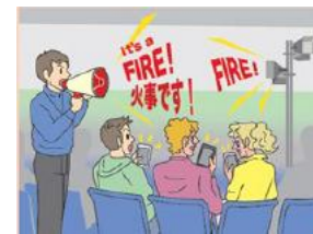
【スマートフォンアプリで多言語表示】