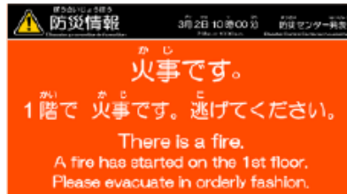
【館内のデジタルサイネージで多言語表示】