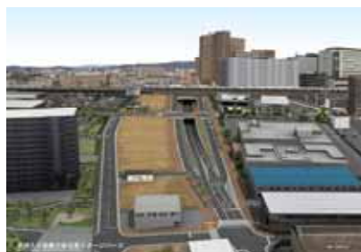
(長洲久々知線立体交差イメージ)

長洲久々知線立体交差、尼崎駅前1号線、 尼崎駅前3号線、長洲久々知線等 施行期間 平成13年度～平成24年度 全体事業費 約140億円 23年度事業 用地測量、用地買収、道路整備工事等