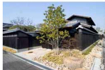
(まちかどチャームング賞の事例)