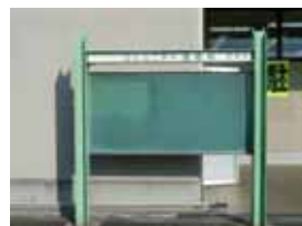
《コミュニティ連絡板地区別設置数（平成22年12月末現在）》