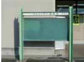
《コミュニティ連絡板地区別設置数(平成23年12月末現在)》