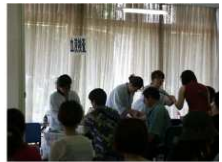
特定健診実施風景