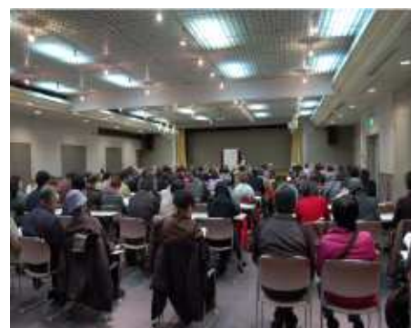
保健指導実施風景