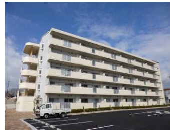
(戸ノ内改良住宅(第 15 期))