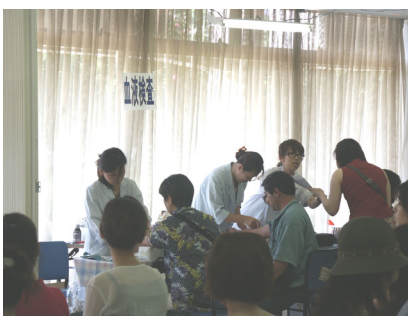
特定健診実施風景