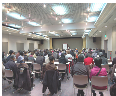
保健指導実施風景