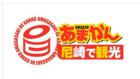
缶詰をモチーフにしたロゴマーク