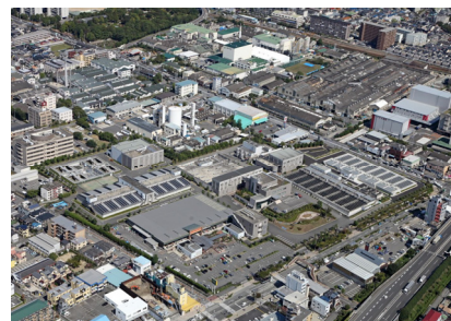
阪神水道企業団尼崎浄水場